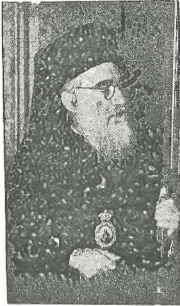
« Ὁ Ἀρχιεπίσκοπος Βορείου καὶ Νοτίου Ἀμερικῆς κ.κ. Μιχαήλ.

» Θέλω σήμερον νὰ θρηνησω μεθ' ὑμῶν τοὺς ὑπὲρ δύναμιν δοκιμασθέντας ἀδελφούς μας τῆς Κωνσταντινουπόλεως καὶ Σμύρνης, » οἱ ὅποιοι ἐν διαστήματι τριῶν ὥρῶν ἔχασαν τὰ πάντα. Μὲ τὸν θρη-