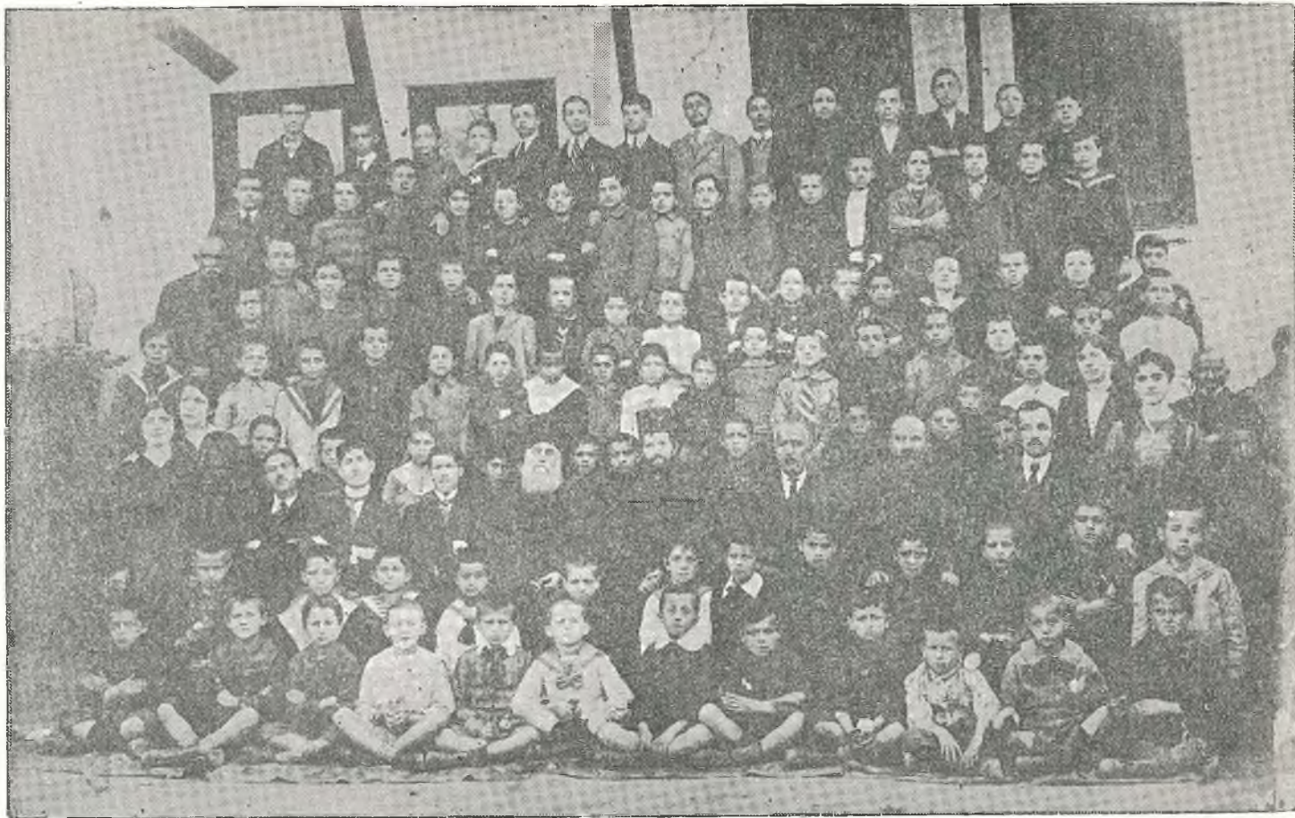
Διδάσκαλοι καὶ μαθηταὶ τῆς Ἀστικῆς Σχολῆς (Ἀρρεναγωγείου) Ραιδεστοῦ ἔτους 1917.