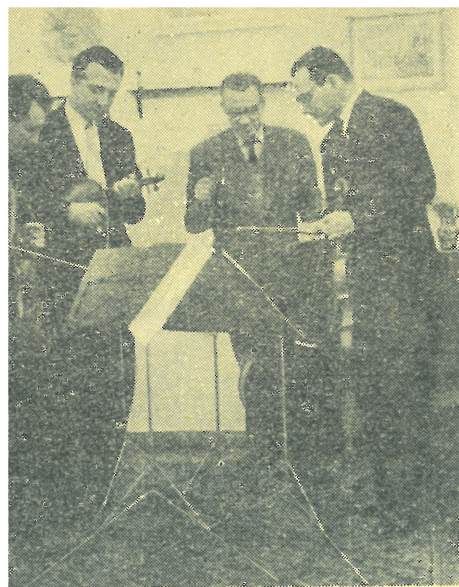
Ω ρ α μ ε λ έ τ η ς

κρστική ένιςχυση, πραγματοποιήσε 20 έμφανίσεις, άριθμύ πρωτοφανή για συγκρότημα μουσικής δωματίου στόν τόπο μας και προσιτό μόνο σε κρστικά ή έπιχορηγούμενα από τό κράτος μουσικά ιδρύματα.