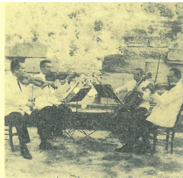
Στό άρχαίο θέατρο Άμφιαράειου