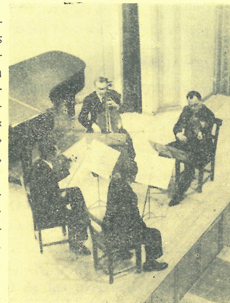
Τὸ Ἀττικὸ Κουαρτέττο στὴν Αἴθουσα «Παρνασσὸς»