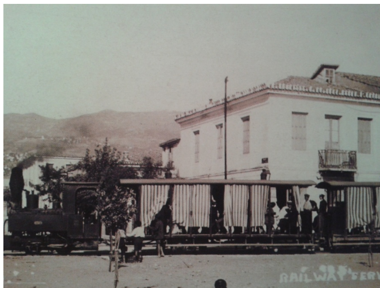
Εικόνα 19. Το καλοκαιρινό τρενάκι στην οδό Δημητριάδος με κατεύθυνση προς Άναυρο.