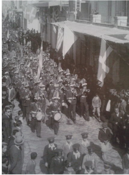
Εικόνα 23. Η Φιλαρμονική κατά την παρέλαση (εθνική επέτειος 1936), επί της οδού Ερμού-Λώρη.