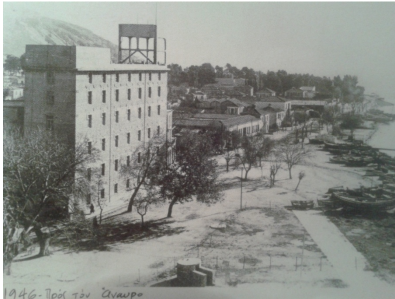
Εικόνα 18. Η παραλία του Αναύρου το 1936

μόνο του στενού μουσικού περιβάλλοντος, αλλά ολοκλήρου της Ελλάδος. Όσον αφορά δε τον κ. Καλτσογιάννη, πρέπει να τονίσω ανεπιφύλακτα, ότι με το προχθεσινό παίξιμό του μας παρουσίασε αναμφισβήτητα δείγματα μιας μουσικής υπεροχής, μιας εκλεκτής βιρτουαζιτέ με ήχο και μουσικής έκφρασιν σπανίαν». 150