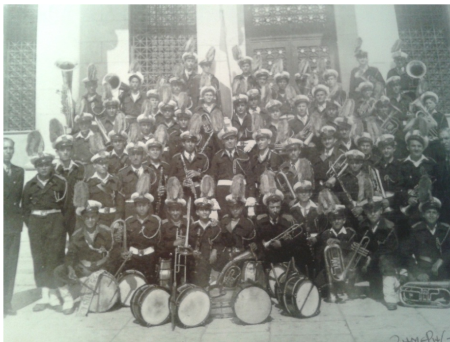
Εικόνα 25. Η Φιλαρμονική Δήμου Παγασών (1949) με τις θερινές στολές έξω από την Τράπεζα της Ελλάδος, στην Παραλία Βόλου (φωτ. αρχείο Φιλαρμονικής).

Το 1958 εκλέγεται νέο διοικητικό συμβούλιο με τον Δήμαρχο Θ. Κλαψόπουλο ως πρόεδρο, τον Ελευθέριο Αδαμόπουλο και τον Φίλιππο Ευαγγελόπουλο ως επιβλέποντες δημοτικούς συμβούλους και τους πολίτες Ανδρέα Γολέμη και Εθ. Τζάννο. Το 1959 εκλέγεται νέο διοικητικό συμβούλιο με τον Θ. Κλαψόπουλο ως πρόεδρο, τους Ευάγγελο Τζάννο και Κων. Αργυρίου δημοτικούς συμβούλους και τους πολίτες Μαργαρίτη Λυμπέρη και Ανδρέα Γολέμη. 190 Τα οικονομικά της φιλαρμονικής είναι ανθηρά, αφού το 1960 έφθασε να έχει τακτικά έσοδα 2.900.000 δρχ. Η φιλαρμονική του Δήμου Βόλου συνεχίζει με αυτήν την μορφή την μακραίωνη πορεία της. Την μπάντα της διευθύνει ο Αλέξανδρος Κάλβος μέχρι το 1969.