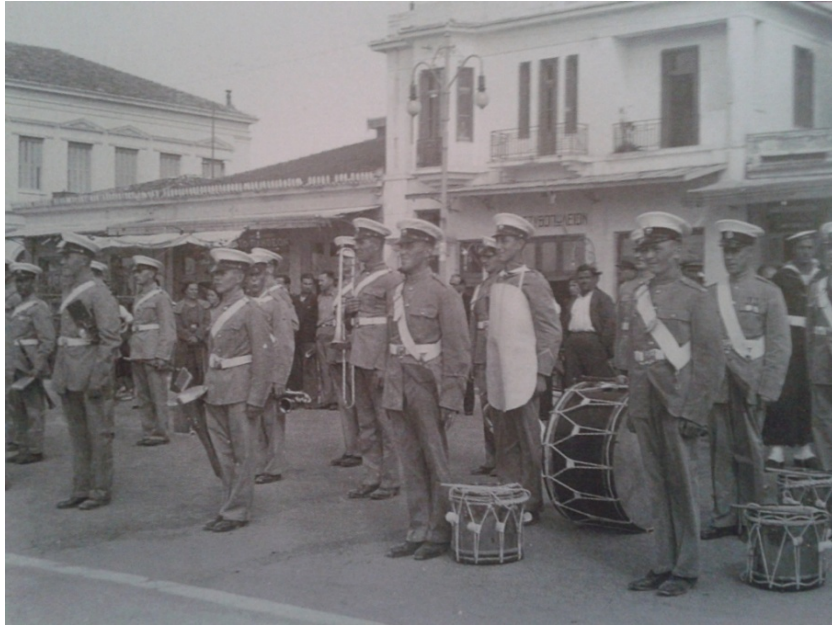
Εικόνα 21. Η Φιλαρμονική του αγγλικού στόλου Repulse (πολιορκητής) στο λιμάνι του Βόλου το 1936.