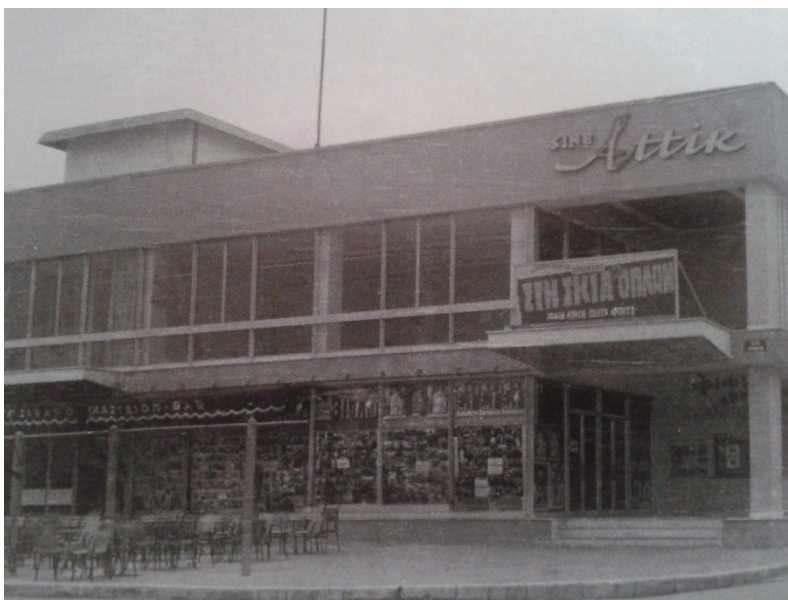
Εικόνα 28. Το Αττίκ.

Οι συναυλίες γίνονταν συνήθως στη διάρκεια των Χριστουγέννων, της Απόκριας ή του Πάσχα στους χώρους «Αχίλλειο», «Θέτις» και «Αττίκ» μέχρι το 1989. Μετά το 1989 οι συναυλίες γίνονταν συνήθως στο Δημοτικό Θέατρο.