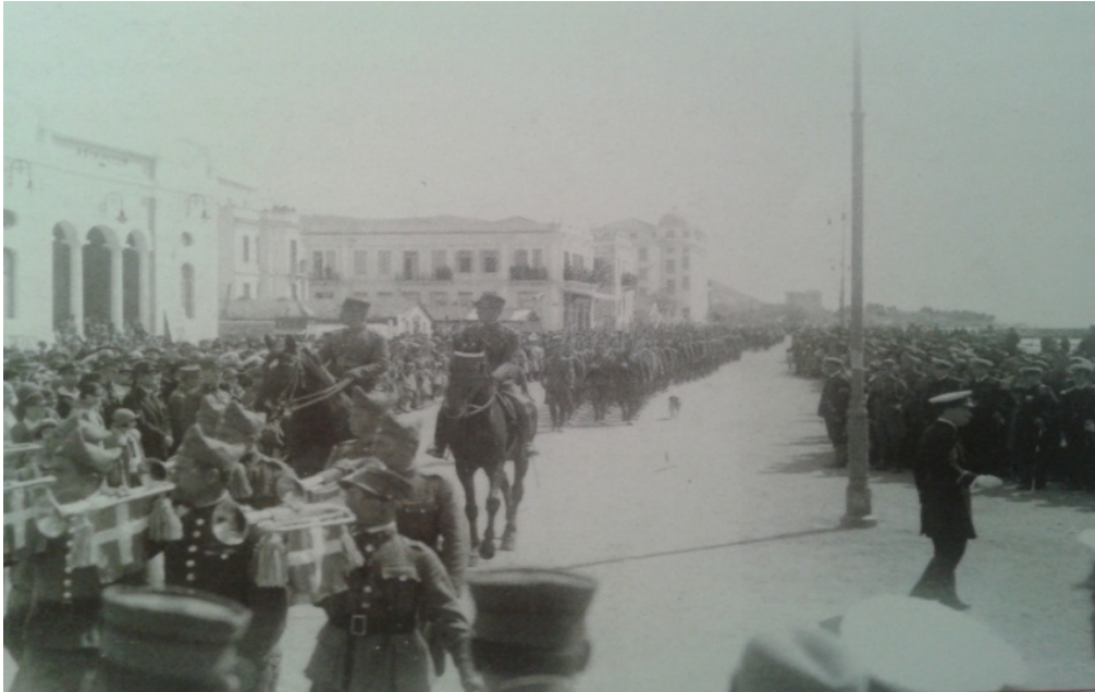
Εικόνα 12. Η Φιλαρμονική μπροστά από το Αχίλλειο στην παραλία.

Από το 1928 συμμετέχει σε κάθε επίσημη τελετή, όπως στα αποκαλυπτήρια του Ηρώου Ακαδημαϊκής Στήλης, που έστησε ο Δήμος Παγασών σε χώρο προ του Θεάτρου και στην τελετή κατάθεσης θεμελίου του νέου Μητροπολιτικού ναού του Αγίου Νικολάου. 131 Επίσης, την Αποκριά δίνει την ετήσια συναυλία μεταμφιεσμένων στην «Εξωραϊστική» με μεγάλη επιτυχία.