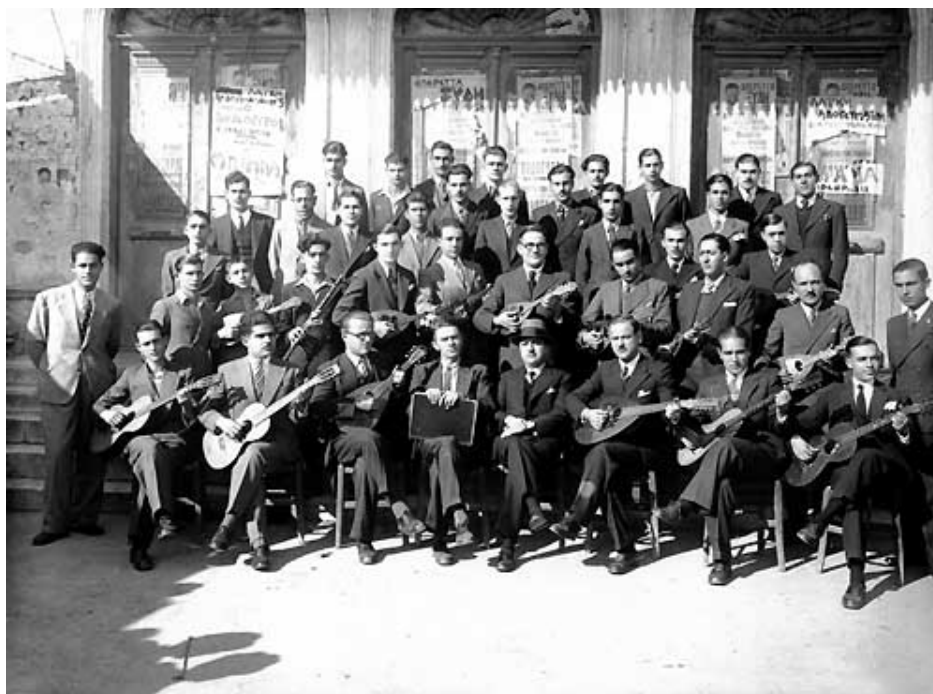
Εικόνα 11. Η Χορωδία και μαντολινάτα της Ένωσης Φιλομούσων έξω από το Δημοτικό Θέατρο.

και - συνεχώς - σύμβουλος της Φιλαρμονικής, ιδρυτής της τοπικής συμφωνικής ορχήστρας κ.ά. 116 Όταν ανέλαβε τη Φιλαρμονική, διαδεχόμενος τον Χ. Σαχίνη, αναγκάστηκε να παραιτηθεί από τη Χορωδία και τη Μαντολινάτα της Ένωσης Φιλομούσων, που στο μεταξύ είχε συσταθεί, για να αφοσιωθεί απερίσπαστος στη Φιλαρμονική με σκοπό να την ενισχύσει μουσικά και οικονομικά. 117