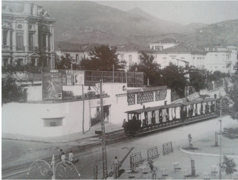
Εικόνα 29. Η «Θέτις» δίπλα από την "Εξωραϊστική"

Κάθε Χριστούγεννα και Πρωτοχρονιά επίσης πρωτοστατεί δίνοντας γιορτινές νότες στις κεντρικές οδούς του Βόλου προσθέτοντας τόνο και ατμόσφαιρα για αυτό και οι πολίτες έχουν συνηθίσει από χρόνια την παρουσία της, μιας και η Φιλαρμονική δεν περνάει απαρατήρητη και χωρίς θαυμασμό. Κάθε χρόνο επισκέπτεται το Αχιλλοπούλειο Νοσοκομείο για τα καθιερωμένα «κάλαντα», το Γηροκομείο και άλλα ιδρύματα της πόλης, γεμίζοντας χαρά και συγκίνηση τους ανθρώπους που βρίσκονται εκεί. 206