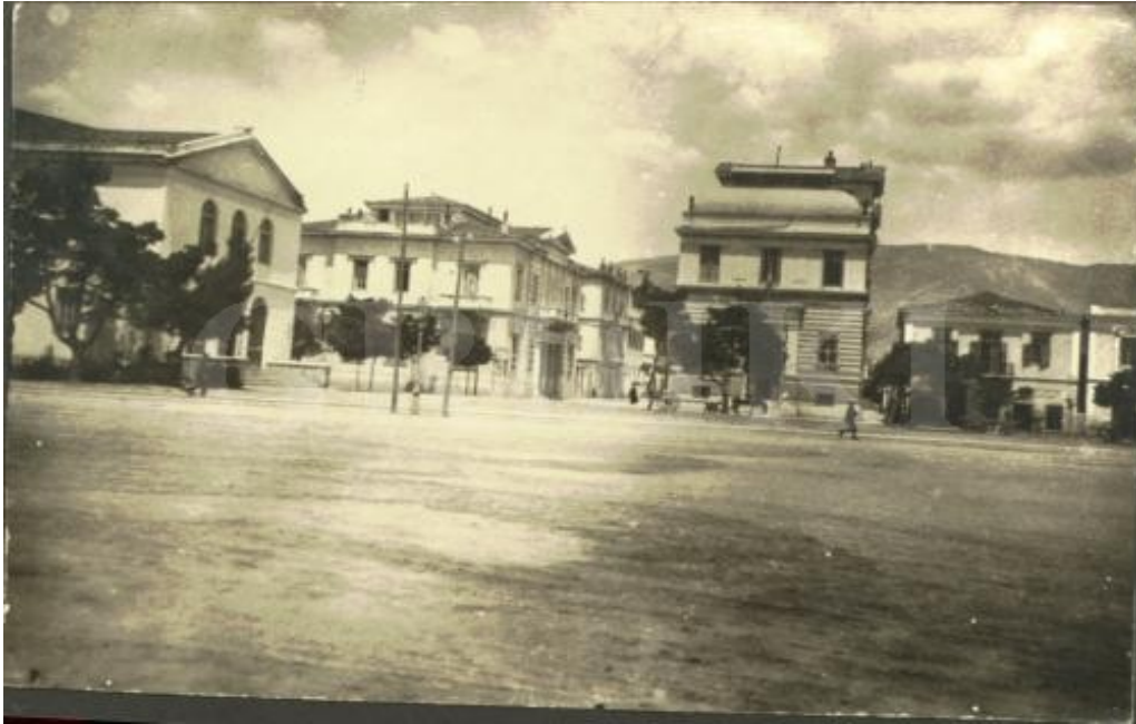
Εικόνα 1. Η οδός Δημητριάδος μπροστά από το παλαιό Δημοτικό Θέατρο, διακρίνονται η Εθνική Τράπεζα και η Τράπεζα Αθηνών. (ψηφιακή συλλογή, ΔΗ.Κ.Ι.).

Σπουδαίο ρόλο ακόμα διαδραμάτισαν οι αδιάκοποι πνευματικοί δεσμοί και η επαφή των Βολιωτών με τους σημαντικούς εγκατεστημένους στην Αίγυπτο επιστήμονες-ομογενείς από τη Μαγνησία αρκετοί εκ των οποίων αφιέρωσαν τη ζωή τους στην πνευματική καλλιέργεια και δράση συνεισφέροντας στην τοπική ανάπτυξη του πολιτισμού και των τεχνών γενικότερα.