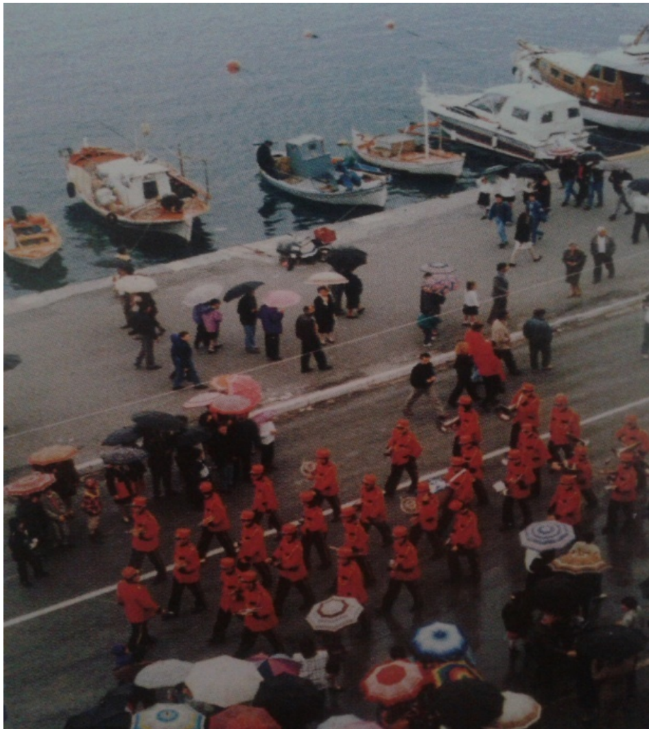
Εικόνα 30. Παρέλαση της Φιλαρμονικής υπό βροχή στην παραλία του Βόλου.