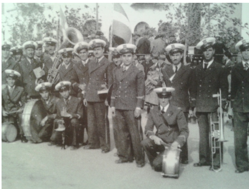
Εικόνα 8. Η Φιλαρμονική Βόλου στη δεκαετία 1930.