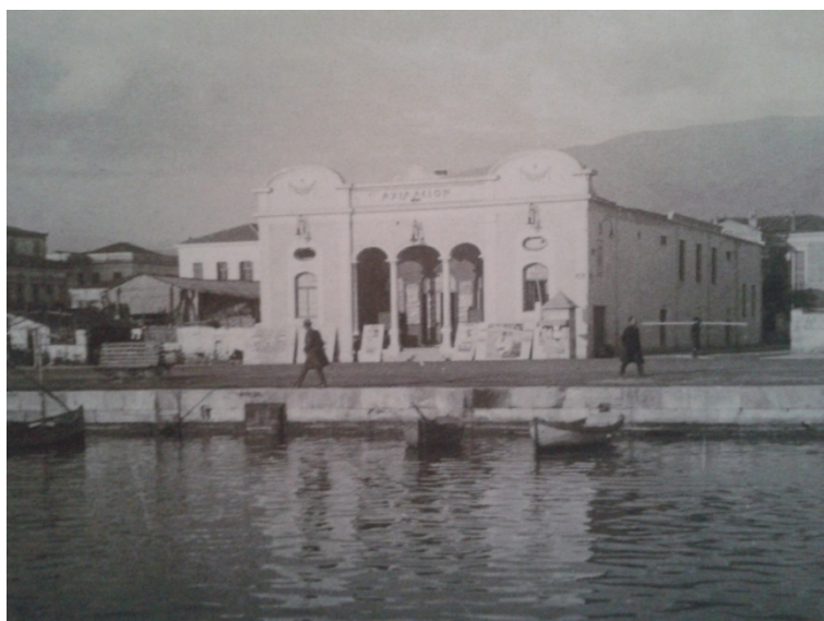
Εικόνα 16. Το παραλιακό κοσμοπολίτικο «Αχίλλειον» που εγκαινιάστηκε τον Οκτώβριο του 1925 και συγκέντρωνε την προσοχή όλου του φιλόμουσου και φιλοθεάμονος κοινού και τον χειμώνα και το καλοκαίρι.