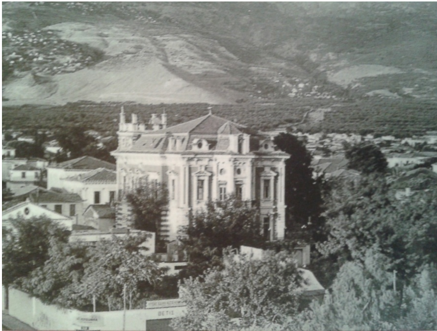
Εικόνα 13. Η "Εξωραϊστική".

στο Ωδείο. Η πρόταση αυτή έγινε ομόφωνα αποδεκτή και επιχορηγήθηκε το ποσό 50.000δρχ για την ενίσχυση του Ελληνικού Ωδείου. 135