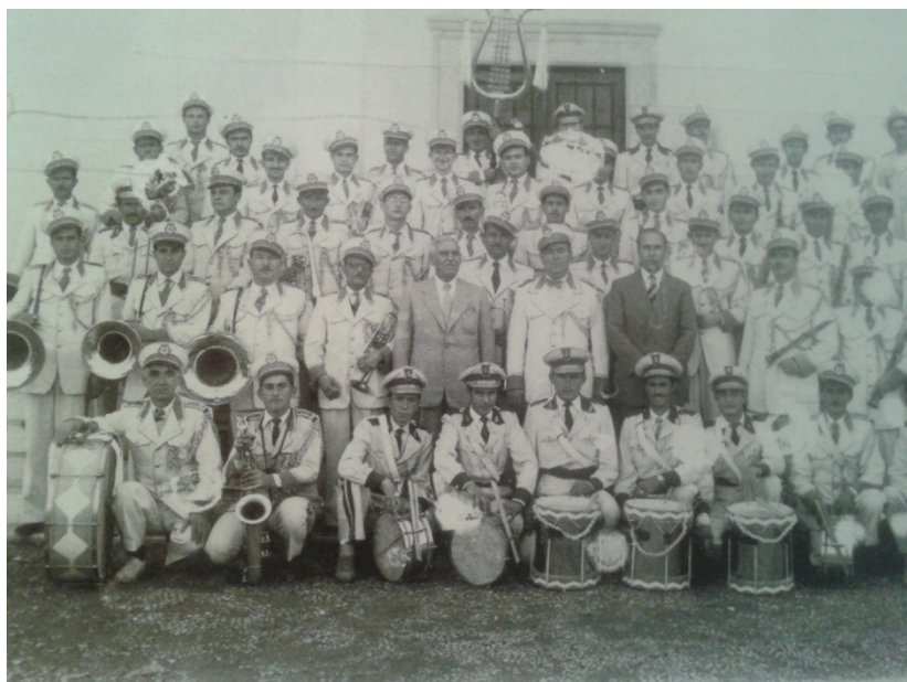
Εικόνα 26. Η Φιλαρμονική Δήμου Παγασών το 1952 στο προάυλιο του Αγ. Νικολάου. (φωτ.αρχείο Φιλαρμονικής).