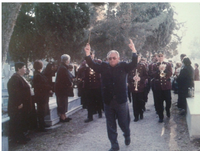
Εικόνα 33. Η Φιλαρμονική στο παλιό κοιμητήριο τη Μ. Παρασκευή.

Τα προγράμματα των συναυλιών ανακοινώνονται συνήθως στον ημερήσιο τύπο και περιλαμβάνουν το πλήρες πρόγραμμα της συναυλίας, γεγονός που δεν συνέβαινε πριν την κατοχή και μετά το τέλος της. Στις υπαίθριες συναυλίες σε πλατείες η μπάντα δεν ανακοίνωνε ποτέ το πρόγραμμα της, σύμφωνα με μαρτυρίες παλιών μουσικών.