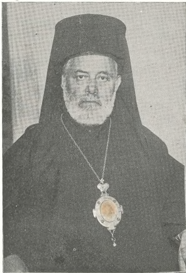
† Ο ΑΕΙΜΝΗΣΤΟΣ ΜΗΤΡΟΠΟΛΙΤΗΣ ΘΥΑΤΕΙΡΩΝ ΓΕΡΜΑΝΟΣ (ΣΤΡΗΝΟΠΟΥΛΟΣ)