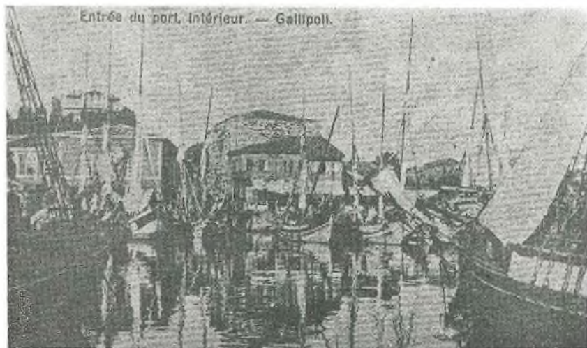
ΚΑΛΛΙΠΟΛΙΣ 1900. Ἐσωτερικὸς λιμὴν ἱστιοφόρων.