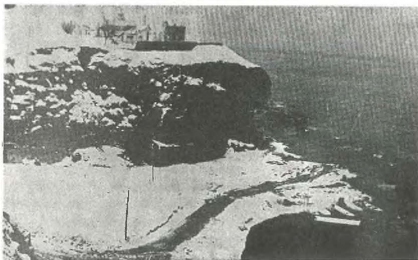
ΚΑΛΛΙΠΟΛΙΣ : Ἡ τοποθεσία «Φανάρι» χιονισμένη.

Ἐξ ἀριστερῶν πρὸς τὰ δεξιὰ. Γραφεῖον ΤΤΤ, Πύργος ὥρολογίου, Διοικητήριον.