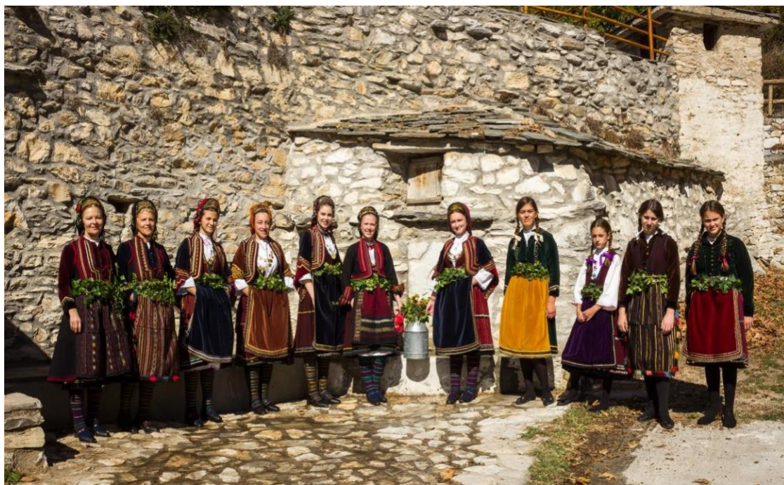
Φωτ.18 Φωτογράφιση στη βρύση (σιόπατλου) του χωριού Χιονοχώρι (Καρλίκιοι) Ν. Σερρών 2017.