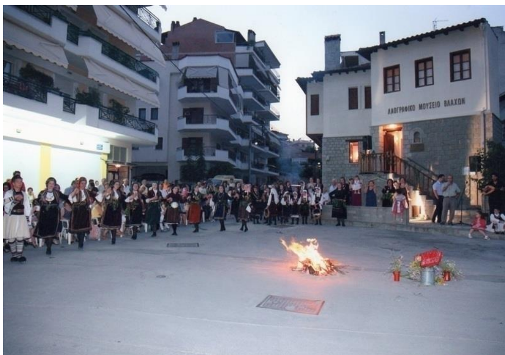
Φωτ. 13 Αναβίωση του εθίμου του Κλήδωνα (γκαλεάτα) από τις γυναίκες του Συλλόγου Βλάχων Ν. Σερρών "Γεωργάκης Ολύμπιος", 23-06-2014.