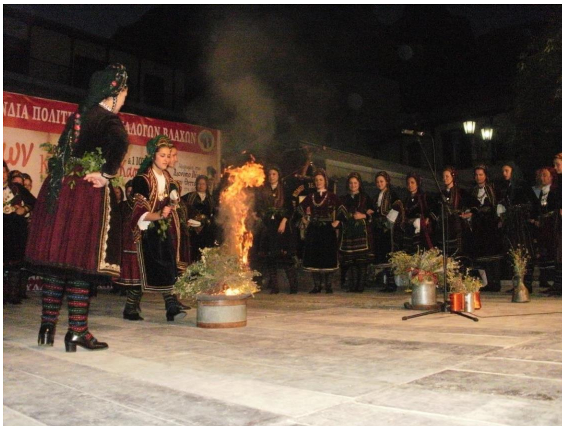
Φωτ. 22 & Φωτ23

Αναβίωση του εθίμου του Κλήδωνα (γκαλεάτα) από τις γυναίκες του Συλλόγου Βλάχων Ν. Σερρών "Γεωργάκης Ολύμπιος", στο 28ο ΠΑΝΕΛΛΗΝΙΟ ΑΝΤΑΜΩΜΑ ΒΛΑΧΩΝ