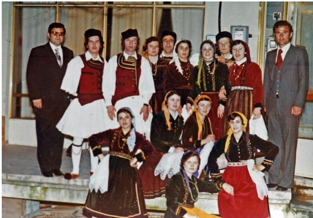
Φωτ. 29 1ο Ετήσιος χορός του Συλλόγου Βλάχων Ν. Σερρών "Γεωργάκης Ολύμπιος". 18-02 1977.

Λαογραφική αίθουσα υποδοχής Συλλόγου Βλάχων Ν. Σερρών "Γεωργάκης Ολύμπιος".