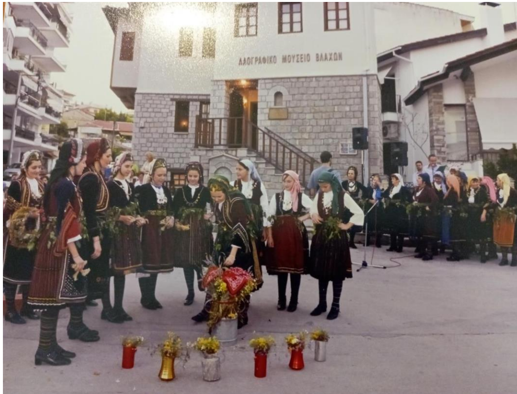
Φωτ.14 & Φωτ.15

Αναβίωση του εθίμου του Κλήδωνα (γκαλεάτα) στην Βλαχογειτονιά Ιμαρέτ, όπου εδρεύει ο Σύλλογος Βλάχων Ν. Σερρών "Γεωργάκης Ολύμπιος". Σέρρες 2004.