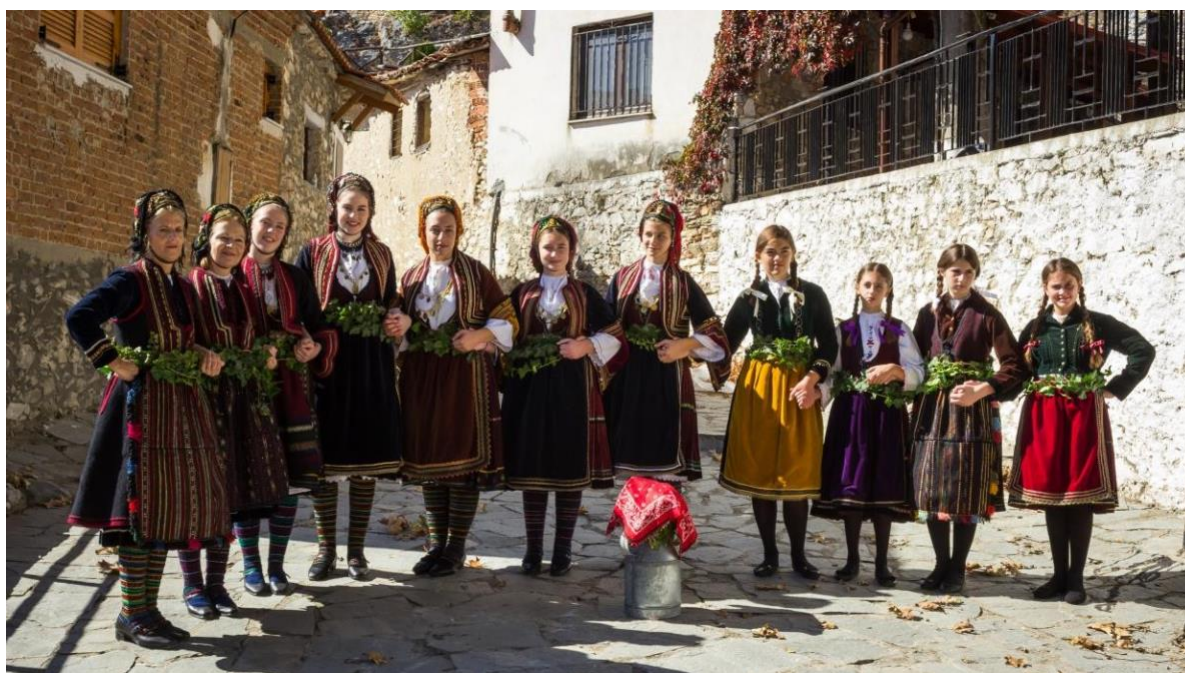
Φωτ.19 Φωτογράφιση στο Μεσοχώρι (Κλάνιτσο) του χωριού Χιονοχώρι (Καρλίκιοι) Ν. Σερρών 2017.