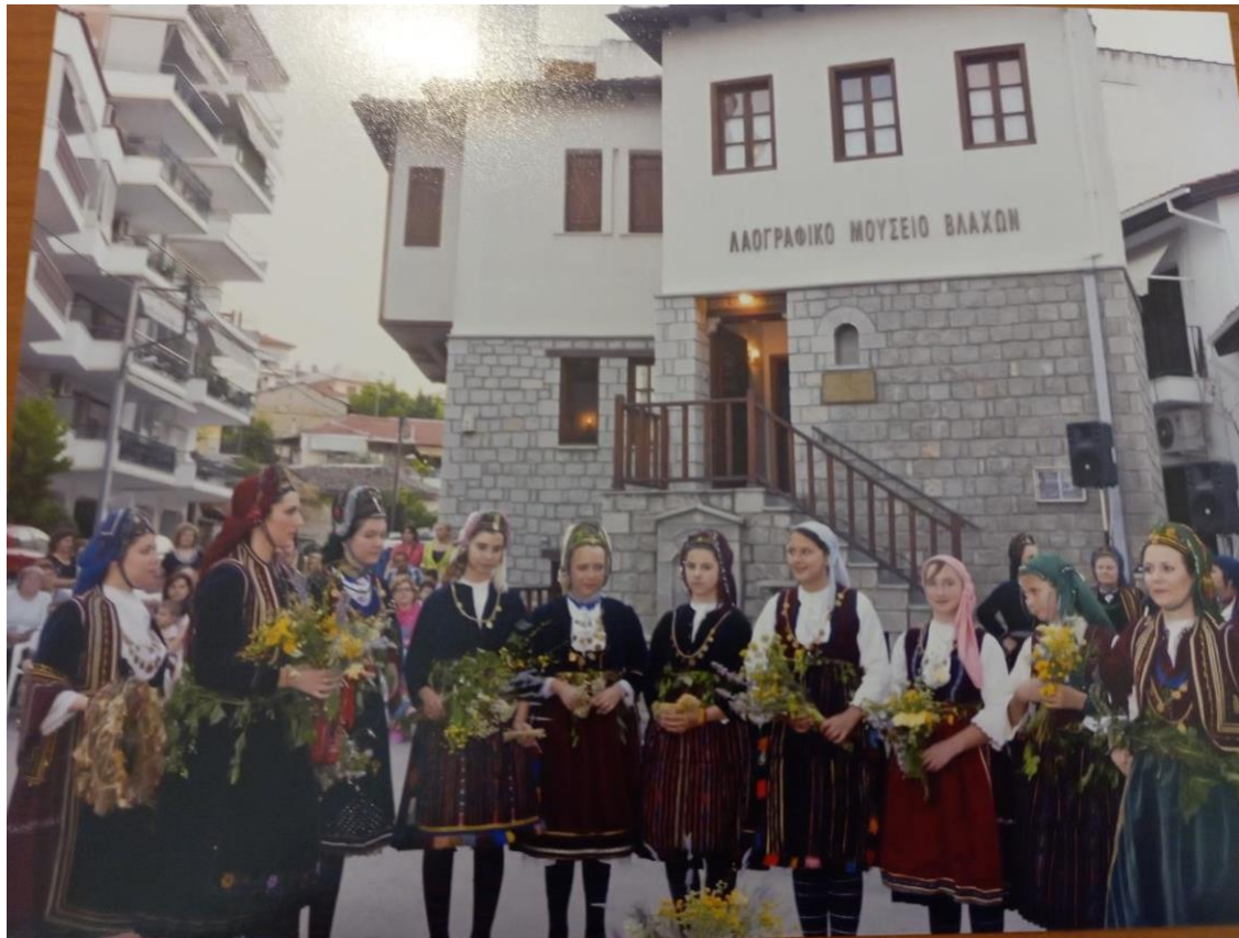
Φωτ. 24 Αναβίωση του εθίμου του Κλήδωνα (γκαλεάτα) στην Βλαχογειτονιά Ιμαρέτ, όπου εδρεύει ο Σύλλογος Βλάχων Ν. Σερρών "Γεωργάκης Ολύμπιος". Σέρρες 2004.