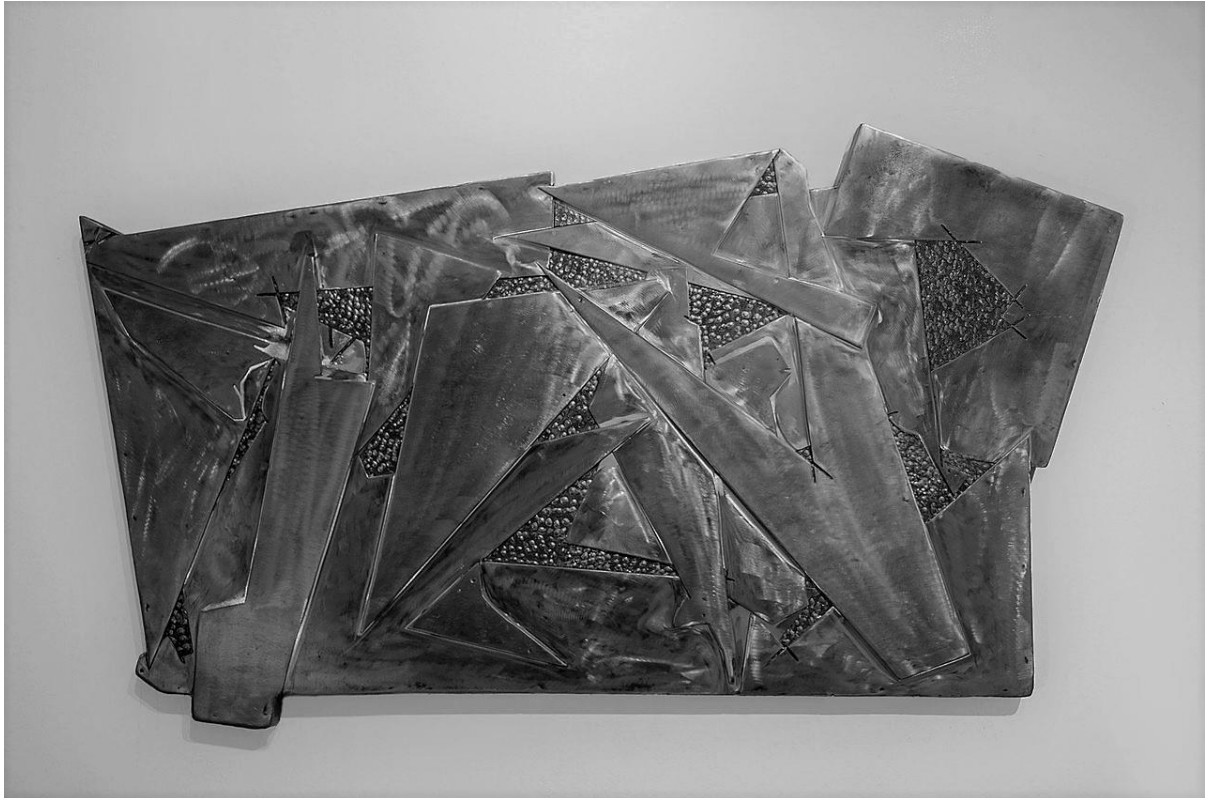
Συμπόσιο , σιδηροκατασκευή του Ιορδάνη Ποιμενίδη

Το έργο στο οποίο βασίστηκε η σύνθεση μου ονομάζεται Συμπόσιο του Ιορδάνη Ποιμενίδη. Είναι μία κατασκευή σιδήρου, ένας ‘μεταλλικός καμβάς’ θα λέγαμε, με γεωμετρικά σχήματα διαφορετικής υφής και μεγέθους που συνδιαλέγονται μεταξύ τους δημιουργώντας έναν οργανισμό. Τόσο το υλικό αυτού, όσο και η δομή του αποτέλεσαν την βάση και τα εργαλεία κατασκευής του έργου μου.