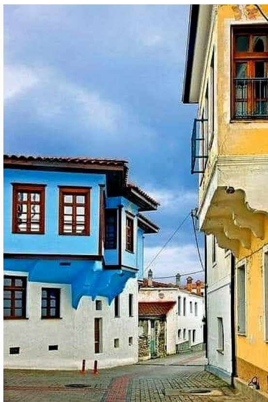
Εικόνα 12: Διατηρητέα αρχοντικά του Βελβεντού σήμερα