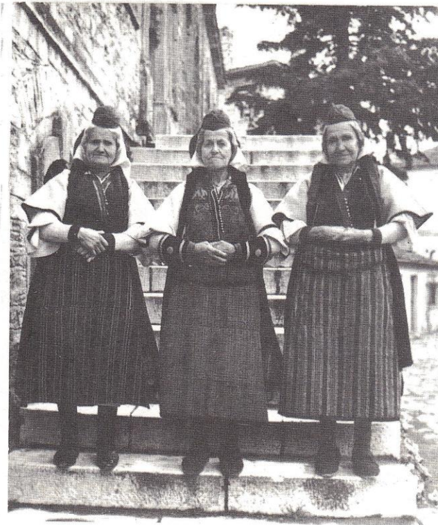
Εικόνα 10: Οι τελευταίες πιστές γερόνισες στο συγγούνι και το καπί (1956) (Πηγή: Από το βιβλίο «Λαογραφικοί Βελβεντού» Τινίκου-σ. 203) Αντίλαλοι του της Αθηνάς Κακούλη, 1992,