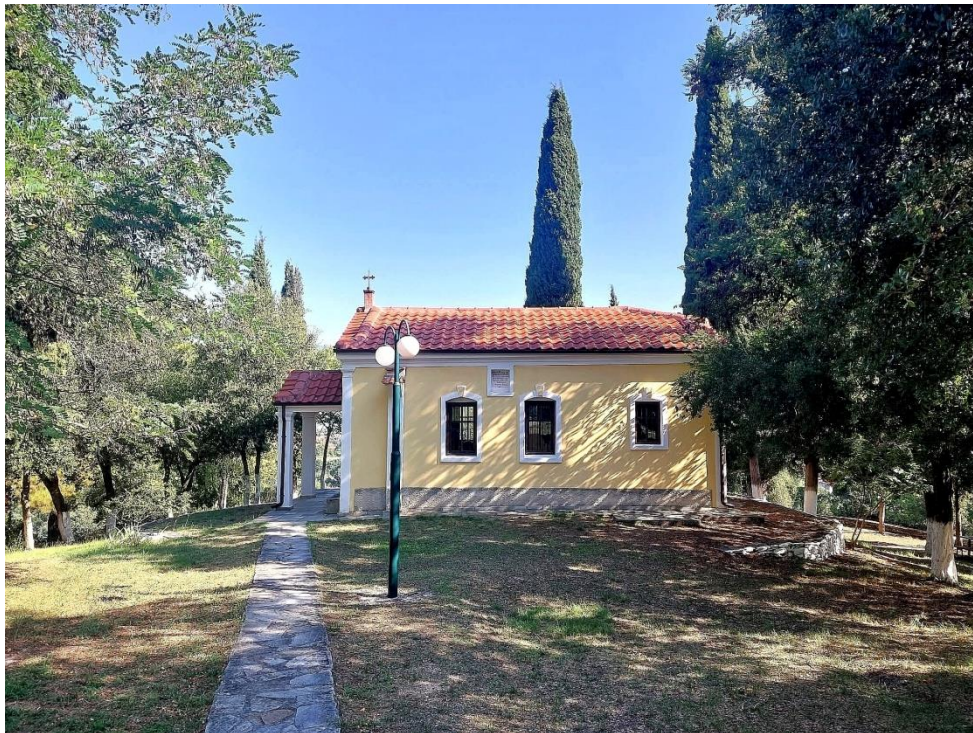
Εικόνα 11: Το ξωκκλήσι του Αι- Λια σήμερα