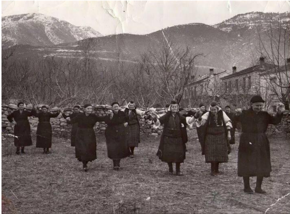
Εικόνα 6: Η πομπή του γάμου στο Βελβεντό, με τα μπρατίμα να χορεύουν