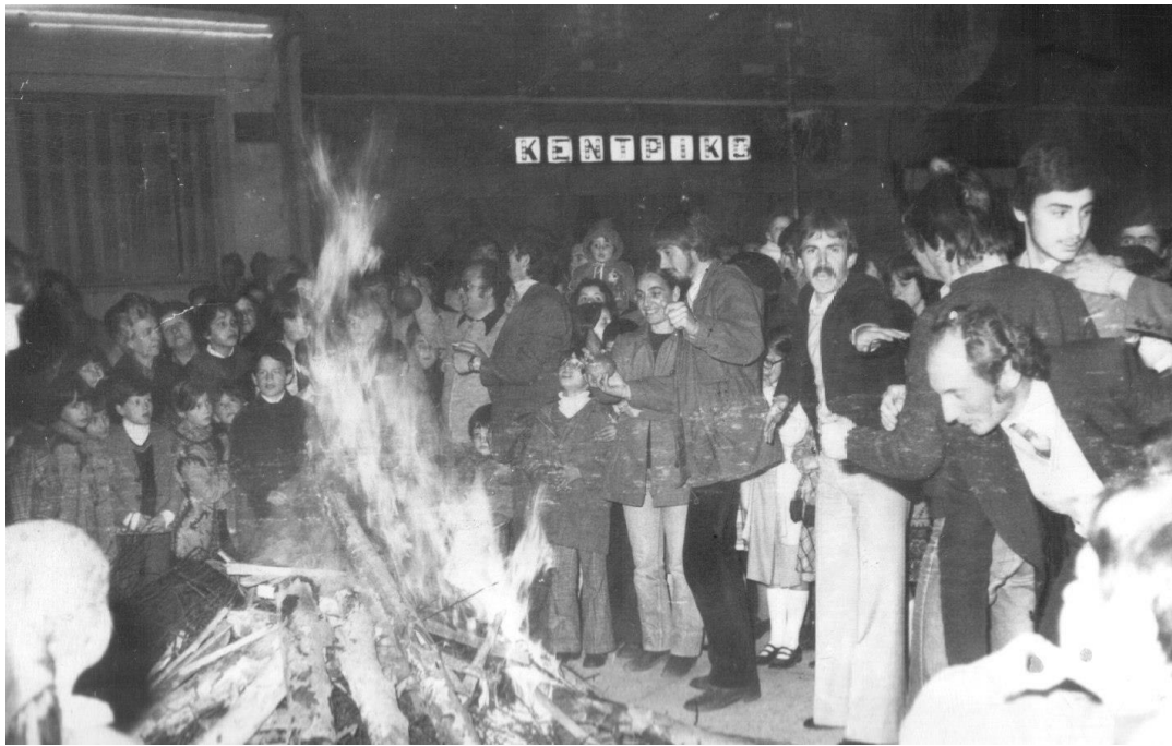
Εικόνα 8: Οικογενειακό τζιμπούσι στο Βελβεντό